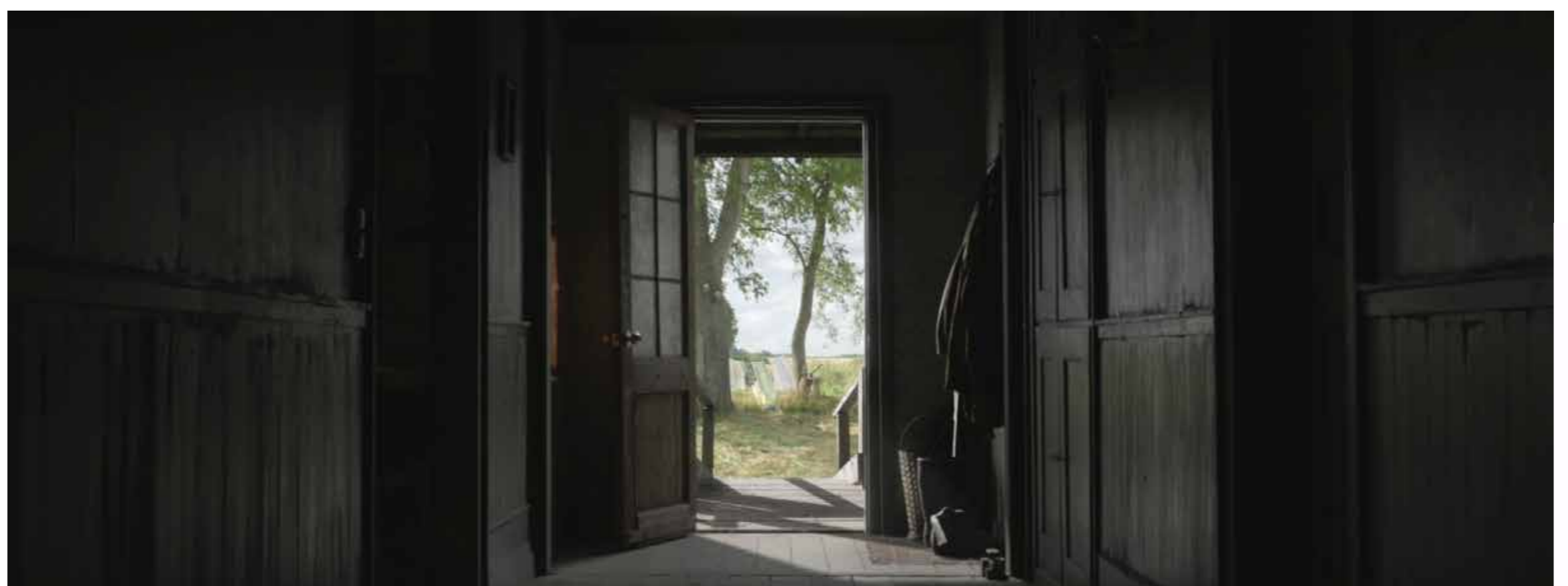
Filmstill, der Sog nach außen: Außen- und Studiodreh zusammengefügt durch Vfx