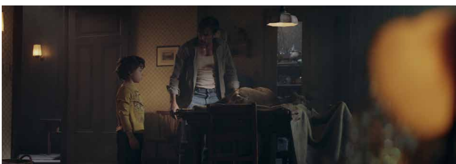
Die Küche im Entwurf und als Filmstill